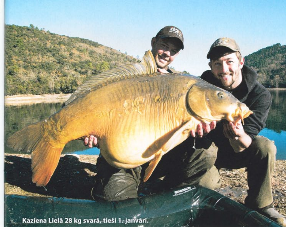
Kaziena Lielā 28 kg svarā, tieši 1. janvārī.

un aukstajā rītā –10 grādos ar apledojušu piepūšamo laivu izvietot ezerā makšķeres. Cimdu man nebija, un jau pēc pirmā kāta ielikšanas es vairs nejutu pirkstus. Airu rokuri bija ledusauksti, aukla uz spolēm bija sasalusi, un laivas beņķi klāja 2 cm ledus. Tomēr mans mednieka instinkts neļāva atslābt, un arī otro kātu es pamanījos nolikt uz pareizā plato. Breda superīgā eholote ar Downscan funkciju (manējā atdeva galus jau pirmajā dienā) uzrādīja zivi 5,5 m dziļumā. Ne kā parastās eholotes, kas zivis attēlo vilnišu formā, Downscan funkcija viņas parāda dabiskajā formā. Es nespēju noticēt savām acīm, bet es tiešām to redzēju aizpeldam gar zemūdens kanti. Klusām ielaidu makšķeri un izmētāju barību plašā teritorijā tai apkārt. Jau pēc stundas bija cope, un mēs pacēlām 20 kilogramus tīra Kaziena zelta – lieliski! Katru dienu mēs esam tikuši pie vienas vai divām zivīm, un, pēc Damjēna domām, šai vietai un šim gadalaikam tas ir ļoti labs rezultāts. Pavadījis dienu kopā ar mums un krietnu devu pārtikas un viņa, viņš pārceļas pārsimts metru tālāk, lai pamakšķerētu viens. Jau pirmajā dienā viņam piesakās tā gada vienpadsmitā zivs virs 25 kg – neticami! Tas