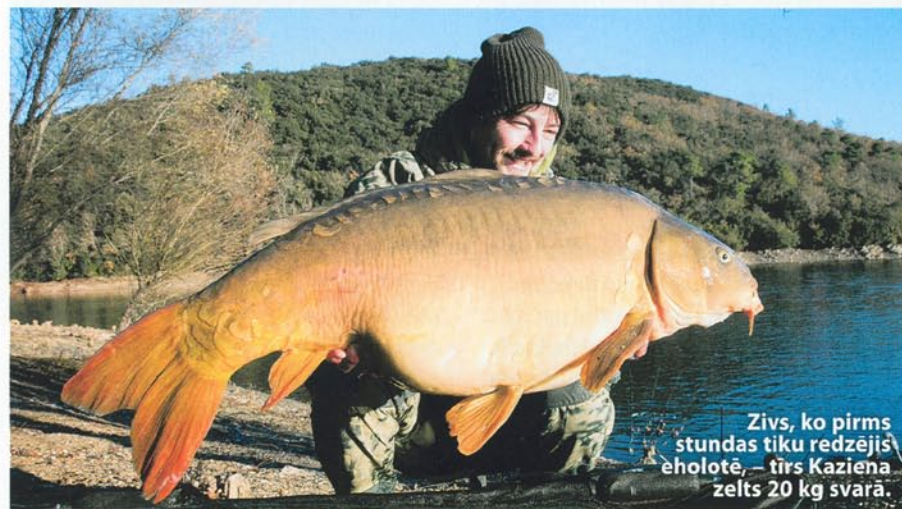
Zivs, ko pirms stundas tiku redzējis eholotē, – tīrs Kaziena zelts 20 kg svarā.

vai aiznākamajā dienā atgriežas baroties. Ja uz grunts viss ir pa vecam, ar zināmu veiksmes piedevu ir iespējams, ka arī āķa ēsma nokļūs mutē. Šis specifiskās teorijas dēļ es nereti iesāktajos punktos papildus barību nedodu un neaiztieku ieliktais makšķeres veselas divas vai trīs dienas. Protams, šoreiz Kazienā tā rīkoties nevar, jo esam likumpaklausīgi, tāpēc visus kātus satinam tieši septiņos vakarā. Tikai vēlāk saprotam, cik fatāla kļūda tā ir. Pirms tam bieži pēc trīs dienu makšķeres noturēšanas ūdenī ir sekojusi cope, un allaž tā bija krietna izmēra zivs. Esmu dzirdējis arī par makšķerniekiem, kas vairākas dienas tur boilas spainī ar ezera ūdeni, lai tās izskatītos vecākas. Godīgi sakot, pats gan šo taktiku tā arī neesmu pamēģinājis. Makšķerēšana ir iegājusi zināmā rutinā, un iekšējais pulkstenis ziņo, ka nedēļa jau ir apkārt. Mēs agri esam gultās un agri ceļamies, lai sagatavotu laivas un dotos uz Rotkehlchenplatz , lai jau iepriekšējā dienā