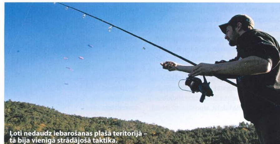
Ļoti nedaudz iebarošanas plašā teritorijā – tā bija vienīgā strādājošā taktika.

Garastāvoklis nomainās vienā sekundē. Ir mazliet pāri septiņiem vakarā, un mūsu kāti joprojām ir ūdenī! Cenšamies likumsargiem ieskaidrot, ka katru vakaru ietinam kātus precīzi septiņos, sakrāmējam mantas un dodamies prom, bet tas nelīdz. Mūs pasludina par ļaunajiem nakts copmaņiem un attiecīgi arī izturas. Saskaņā ar datiem saule šeit rietot 17:22. Pielieciet vienu stundu un sanāk 18:22... Okei, mēs esam mazliet pāri laika limitam, bet šajā pēdējā stundā mums ir visvairāk copju. Žandarmuprāt, mūsu kātiem krastā bija jābūt jau piecos, un nekādas iebildumus tie dzirdēt negrib. 135 eiro par nakts makšķerēšanu no personas (šāds sods ir arī Ziemeļfrancijā) un pavēste ierasties tiesā. Kad un kur jāierodas – mums nav ne jausmas. Par laimi, inventārs netiek konfiscēts, tomēr aprakstīts un safotografēts gan. Mēs tiešām nebijām gaidījuši ko tādu no brīvprātīgajiem kārtības sargiem un esam pārsteigti par viņu spēka un dusmu izrādīšanu. Kazienā mēs pametām dienu agrāk, nekā plānots, bet ir absolūti gana. Ir laiks aizvērt šīs ziemas pasakas pēdējo lappusi. Līdz nākamajai reizei. ●