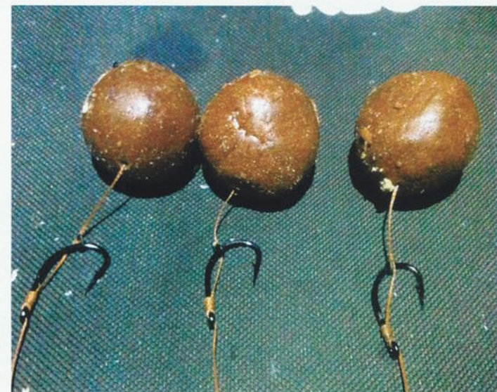
La masilla Liquid-Powder (masilla maravilla) cambio las cosas 180°.

ron Thomas Blazek y Jarda. Así todo fue mucho más fácil y esas fotos son el mejor recuerdo del viaje. Después de aquella noche loca, debido al número de picadas, cambié de estrategia a mediodía. Cambié de lugar. Quería estar más cerca de las carpas. Como se había calmado un poco el tiempo, no perdí la ocasión de moverme. Las cañas estarían preparadas cuando volvieran el tiempo y el viento, con las tormentas... ¡Olía a carpas, a grandes carpas! Pero esto será otra historia. ●