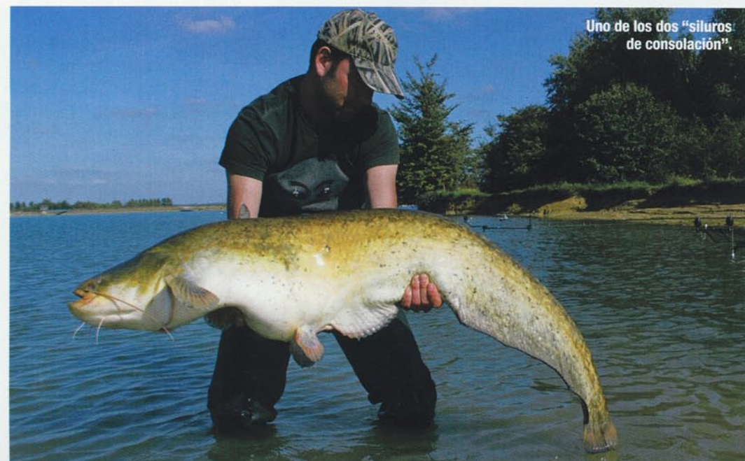
Uno de los dos "siluros de consolación".

Había alertas por lo que pudiera venir del oeste. A mi llegada aún parecía verano. Durante el anterior viaje con René pensé dónde quería pescar cuando llegara el otoño. El lugar estaba vacío y no había pescadores por la zona... Y las primeras nubes llegaron. Acerté de lleno: ¡Mejor imposible, esto después de dos semana y media de calor, y estaba aquí! Thorsten venía al día siguiente. La primera noche pasó sin picadas. Ni siquiera un siluro para contemplar. El viento se hacía más y más fuerte. Thorsten llegó por la tarde y esperábamos con impaciencia los días siguientes. Estábamos pre-