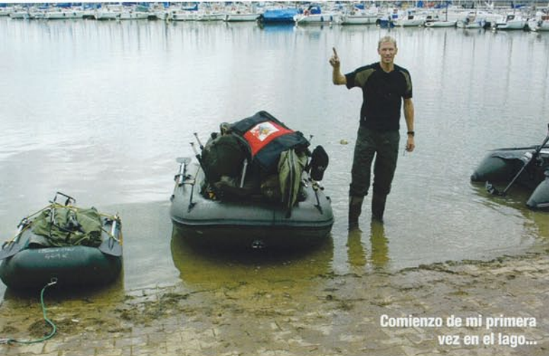
Comienzo de mi primera vez en el lago...