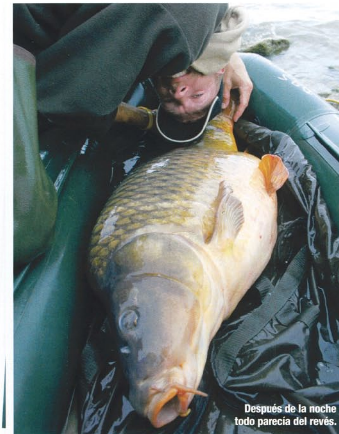
Después de la noche todo parecía del revés.

Desafortunadamente perdí tres carpas en 12 horas. La pérdida se produjo de distintas formas, y cada pez perdido suponía una hora para volver a