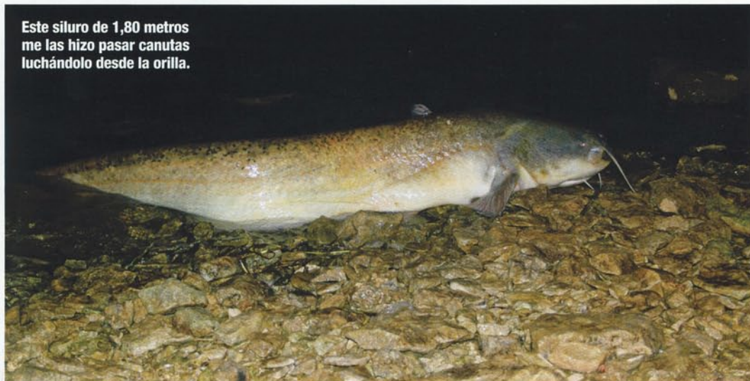
Este siluro de 1,80 metros me las hizo pasar canutas luchándolo desde la orilla.

Hay dos factores a tener en cuenta: primero, usar bajos de línea más largos de lo normal (para evitar enredos con las piedras), y segundo, conseguir que la piedra se libere eficazmente. En mi caso lo consigo atando la piedra mediante una goma elástica, y empleando el Snag Clip de CRU prefijando la intensidad de liberación del clip según las condiciones. Así consigo un doble sistema de liberación (la goma y el clip )