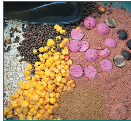
Привлекательная прикормка в сочетании с эффективными аттрактантами и мелкофракционными взвешенными частицами или овсяными хлопьями на фоне зеленого дна создает привлекательное прикормочное пятно

горстями хорошо заметных белых овсяных хлопьев, которые в сочетании с жидкими добавками делают смесь еще более инте-